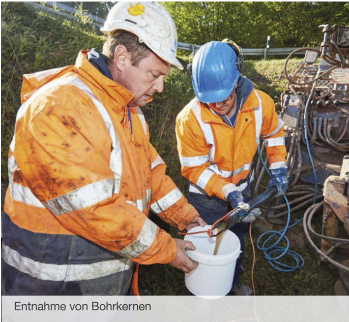
Entnahme von Bohrkernen

Mindestens genauso wichtig für die Planung sind unsere Baugrunduntersuchungen , die in der zweiten Jahreshälfte beginnen sollen. Durch Bohrerkundungen in allen Korridorsegmenten erhalten wir detaillierte Kenntnisse über Baugrund und Bodenbeschaffenheit. Die Ergebnisse helfen uns, den raum- und umweltschonendsten Leitungsverlauf zu finden und geeignete Verlegemethoden zu wählen. Darüber hinaus wird eine Erfassung bodenkundlicher Kennwerte weitere Grundlagen für die Berücksichtigung von Belangen des Bodenschutzes während der Bauausführungsplanung liefern.