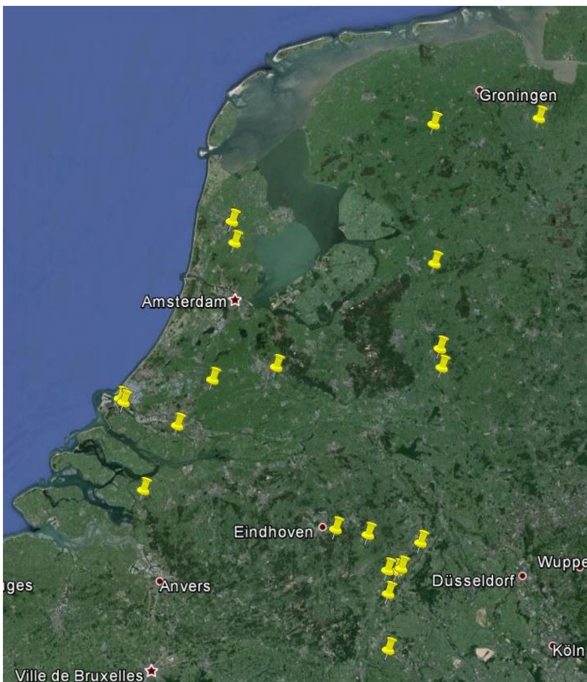
Figuur 1 Verdeling van bezochte adressen van paardenhouders en maneges in Nederland.

De geïnterviewde paardenhouders zitten verspreid over heel Nederland, met een flink aantal in het zuiden van het land.