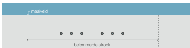
Risicozone ondergrondse hoogspanningsverbinding.